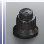
Sure-Lite™ Electronic Ignition System