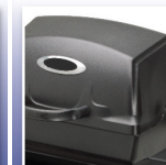
Die Cast Aluminum Oven