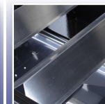
Stainless Steel Vapourizer Cooking System